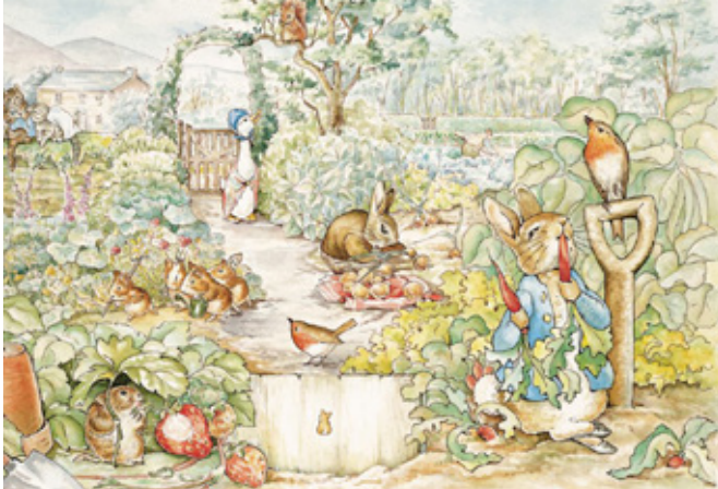
Illustrator: Beatrix Potter